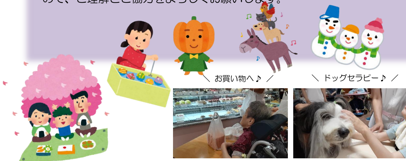
＼ お買い物へ♪ ／